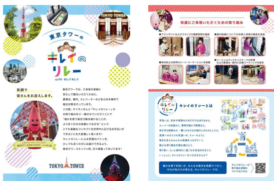
▲『キレイのりー』冊子のイメージ