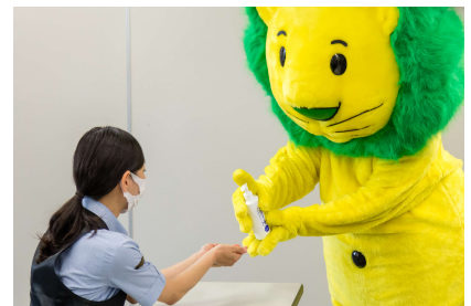
▲「出張清潔衛生授業」のイメージ

当社では、今後東京タワーと共に、お客様も楽しみながら清潔衛生行動に親しんでいけるような以下のイベント等を予定しています。