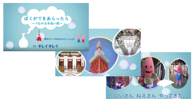
▲『ぼくが手をあらったら～つながる手洗い歌～』動画のイメージ