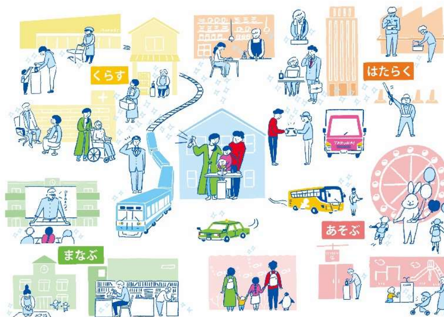
▲『キレイのレレー』今後の展開イメージ