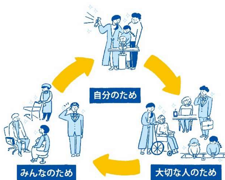
▲『キレイのレレー』概念図

『キレイのレレー』プロジェクトは、様々な事業者との協働により“大切な誰かを想い、清潔衛生行動をとることが、自分の生活を支える誰かの笑顔を生み出していく”という考えを伝えるために、本プロジェクトの趣旨にご賛同頂いた事業者の方々と一緒になって、人と人との触れ合いにあふれ、人と寄り添いながら、もっと前向きに過ごせる社会を目指していくプロジェクトです。