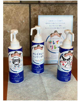
▲東京タワーでの実施の様子