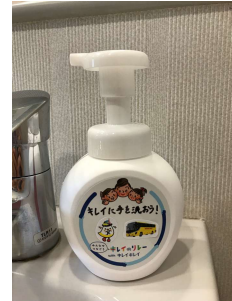
▲はとバスでの実施の様子