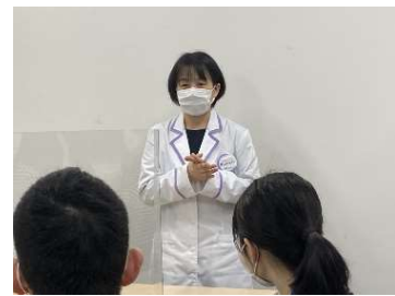
▲「出張清潔衛生授業」のイメージ