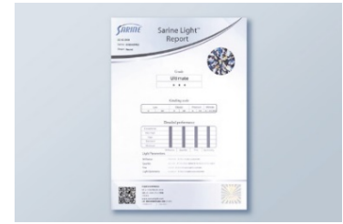
購入したダイヤモンドに輝きの評価がつく

エクセルコ ダイヤモンドのダイヤモンドは「サリネライト」で評価されるダイヤモンドの99%以上が最上位評価を獲得していることから、ダイヤモンド本来が持っている輝きを存分に堪能できます。