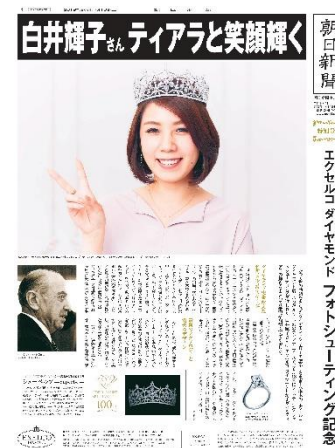
＜パーソナル新聞イメージ＞

ティアラをつけた写真撮影に加え、別途お申込みいただくと、ご自身のお写真とお名前が掲載された「パーソナル新聞」を発行することができます。また、自身だけの特別な新聞は、ご自宅にお送りいたします。