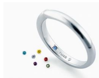
▲シークレットストーン