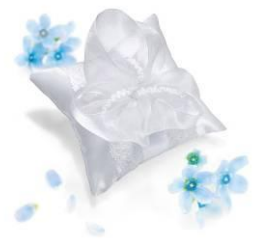
▲オリジナル高級リングピロー