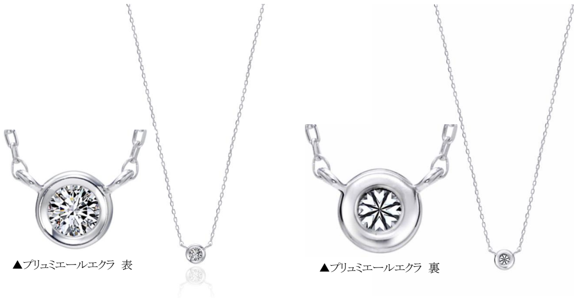
▲プリュミエールエクラ 表

婚約指輪などブライダルジュエリーをメインに扱う「エクセルコ ダイヤモンド」(本店:東京・銀座)は、1997年7月26日に東京本店をオープンさせてから、今年で18周年を迎えます。ダイヤモンドに真の輝きを与え続けてきたエクセルコは、18周年を記念して2015年7月11日(土)～2015年7月26日(日)の期間中、「ANNIVERSARY FAIR ～DEBUT IN JAPAN 1997.7.26～」を開催いたします。この度のフェアの開催に合わせ、新作のファッションライン「プリュミエールエクラ」の販売を開始いたします。