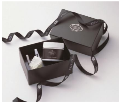
▲ジュエリークリーナー