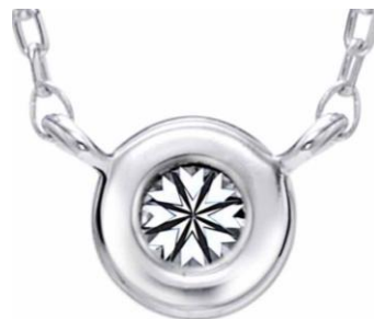
▲プレミアムエクラ 裏 フクリンタイプだからこそ見えるハートマークが、エクセルコのダイヤモンドの質の高さを表しています。