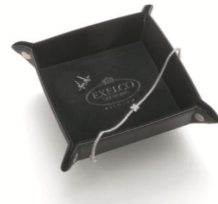
▲ジュエリートレイ