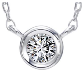
▲プレミアムエクラ 表