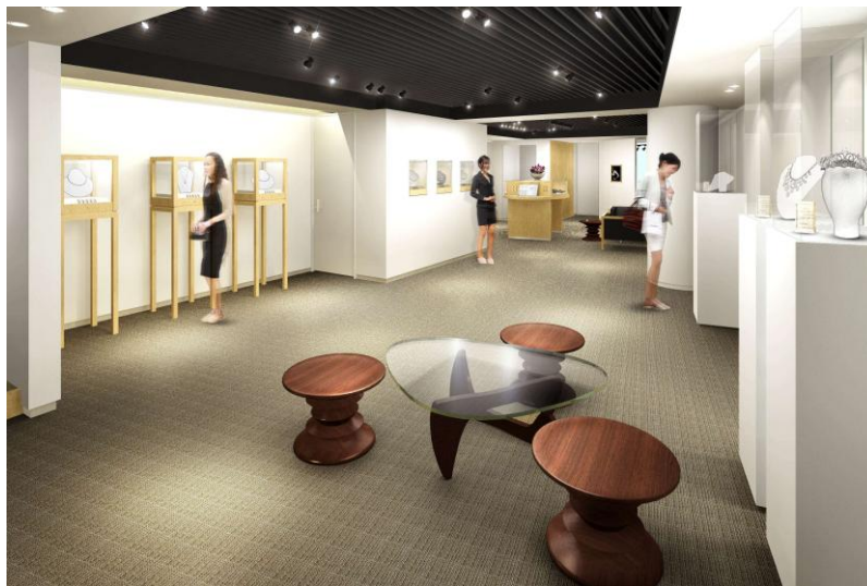
↑店内イメージ画像

婚約指輪などブライダルジュエリーをメインに扱う「エクセルコ ダイヤモンド」(本店:東京・銀座)では、2015年 3月 20日(金)にオープンする「NEW ART LAB(ニューアートラボ)」にて、オリジナルフルオーダーに対応するジュエリーブランドの一つとして、ダイヤモンドを提供いたします。