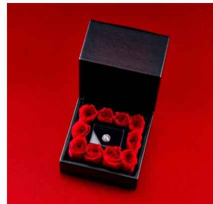
▲ダイヤモンドルース専用ローズボックス

ローズボックスに使用されている小さなバラ(ビビアンローズ)のお花は、「永遠に枯れない」と称されるプリザーブドフラワーです。