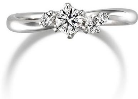
Smiling Suzuran スマイリング スズラン