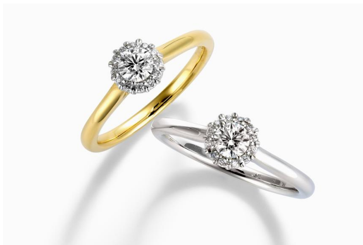
左上:Smiling Himawari スマイリングひまわり 右下:Smiling Peony スマイリング ピオニー