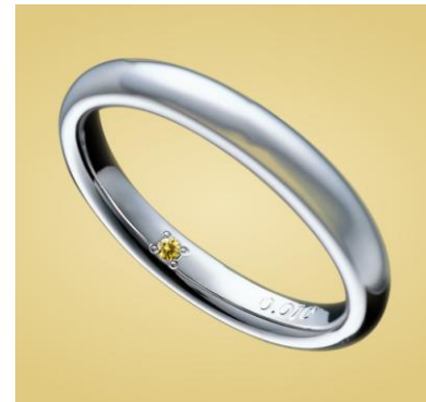
▲シークレットストーン

“ダイヤモンドを贈り合うことで始まる輝き”や“ダイヤモンドを贈り合うよろこび”を感じていただくために、“Yellow Diamond”の他 18 種類の中から、カップルにつき一石をプレゼントいたします。