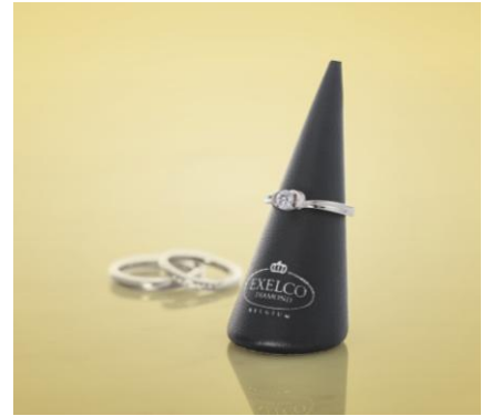
▲EXELCO オリジナルリングホルダー