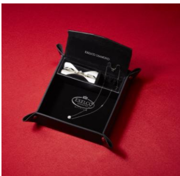
▲EXELCO オリジナルジュエリートレイ

期間中、マリッジリングをご成約いただいた方全員を対象に、「EXELCO オリジナルジュエリートレイ&ボックス」をプレゼントいたします。 ※無くなり次第終了