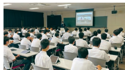
福岡工業大学附属 城東高等学校での講演