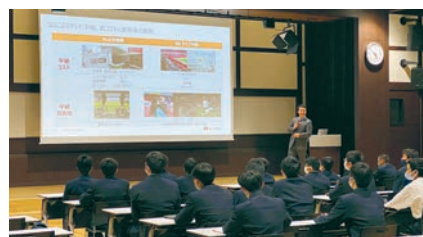
東福岡高等学校での講演