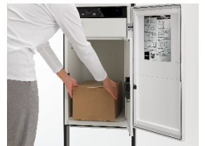
スマート宅配ポスト