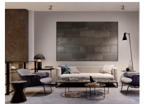
エコカラットプラス