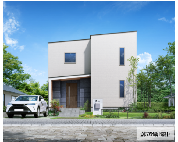
『Lodina』外観イメージ(スタイリッシュモダン)

今回は、アイフルホームが強みとする子育て世帯に向けた「子育て提案」を取り入れた新プランを追加し、この世帯での受注拡大を目指します。さらに、LIXILと共同し選定した、お客様の理想の暮らしに合うお勧めの住宅設備をパッケージ化した提案も用意しています。セミオーダーによる間取りのカスタマイズに加えて、ユーザーの生活スタイルに合わせた住宅設備を追加でき、より一層理想の住まいを実現していただくことが可能となりました。