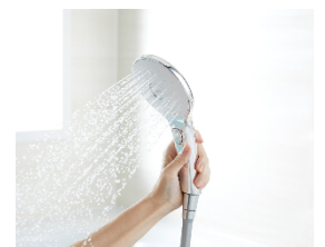
スイッチ付エコアクア シャワーSPA