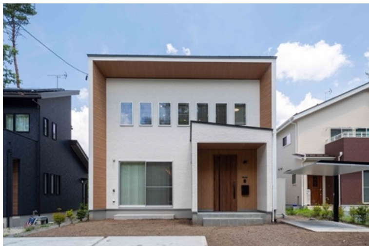
最優秀賞 受賞店:フィアスホーム佐久平店