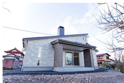
優秀賞 受賞店:フィアスホーム山形店