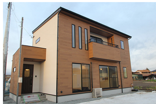
優秀賞 受賞店:フィアスホーム甲斐山梨店