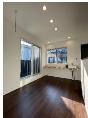
(左から)ダイニング、玄関、中二階、二階リースペース