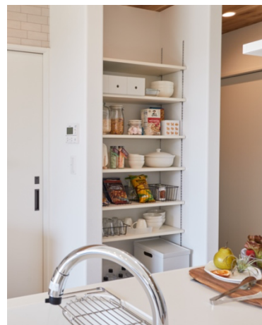
キッチンの扉の無い収納スペース