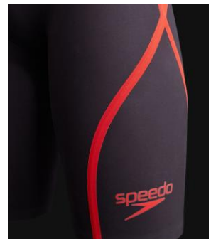
4、ハイコンプレッション