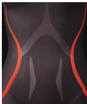
2、アブ・アクティベーター