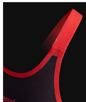
3、コンフォートショルダー ストラップ