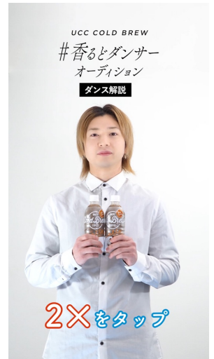
香るとダンス解説動画も!