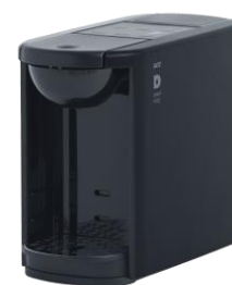
DP3 (K) (業務用専用カラー)