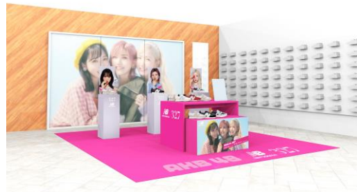
ABC-MART GRAND STAGE 銀座2階 特設ポップアップ

また、ABC-MART GRAND STAGE 銀座2階で、9/23より特設ポップアップを開催します。