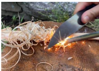
メタルマッチ火起こし ちょっとしたコツでお子様でも 火起こしができるようになる ワークショップ