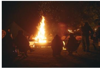
CAMPFIRE キャンプの醍醐味 心地よい軽井沢の秋の夜を