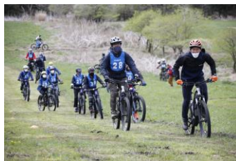
タンデムスタイルによる 2輪と触れ合おうコーナー バイク、電動バイク、 電動アシスト自転車の 展示・試乗を実施