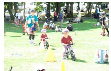
バランスバイク バランスバイクに乗って大 自然を感じながらスタンプラリー を完成させよう！！