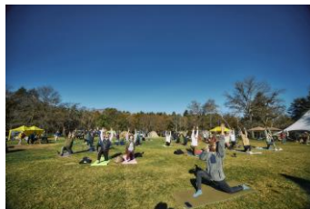
森の中の深呼吸、朝のヨガ体験 一日の始まりを元気にスタート！