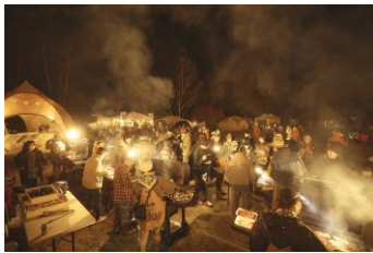
ふるまいBBQ 毎年大好評 DANNER CAMP名物企画