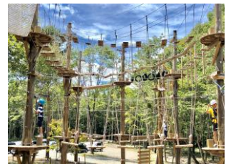
ツリークライミング 小さなお子様も楽しめる 本格的なツリークライミング