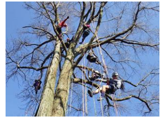
スカイアスレチック 「アウルアドベンチャー」 子供から大人まで楽しめるアスレチック