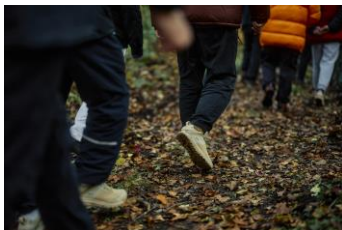
トレッキング DANNERのトレイルモデル "TRAIL 2650 GTX"をお貸出し