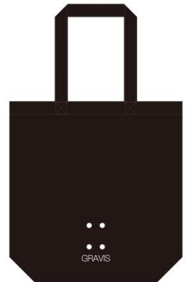
オリジナルトートバッグ

特典：購入者にはGRAVIS SKATEBOARDINGライダーのサイン入りポスター POP-UP期間に来店し、GRAVIS SKATEBOARDINGとinstantのインスタグ アカウントをフォローしていただいたお客様に先着でトートバッグを プレゼント（なくなり次第終了）