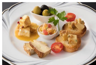
写真は2名様分(イメージ)