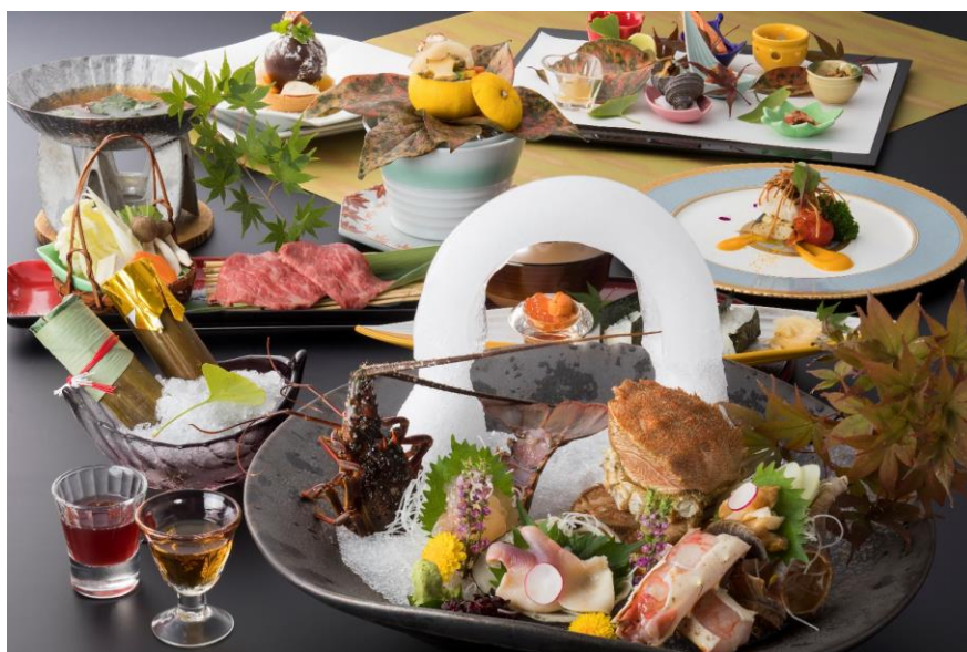
「豪快 厳選冬会席」メニュー（イメージ）

全国にホテル・旅館など21施設を運営する当社は、北海道で初の本格的洋式ホテルとして誕生した札幌グランドホテルなど北海道内で4施設を運営しております。今回の特別会席「豪快 厳選冬会席」は、北海道と和歌山の調理人が食材選びからメニュー構成にいたるまで一緒に吟味し企画いたしました。コロナ禍でご旅行に行けない方々へも本場北海道と和歌山の豪華饗宴会席をご提供いたしたく存じます。ぜひこの機会に本場の味覚をお得にご体験ください。