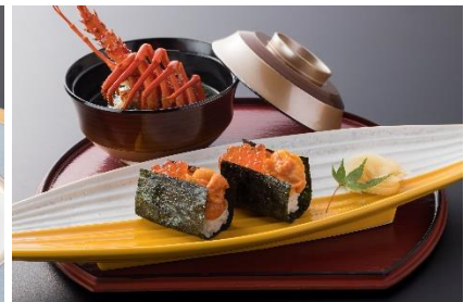
雲丹と鮭卵の勝手寿司 / 伊勢海老の袱紗味噌仕立て