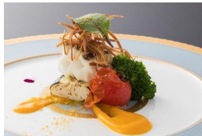
クエときんきの出会い