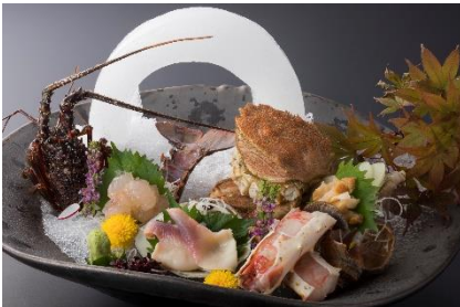
円月島と道産盛り合わせ ※写真は2名様分です