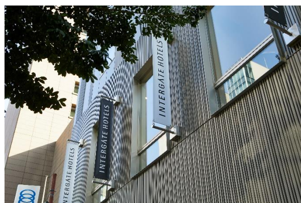
ホテルインターゲート東京 京橋