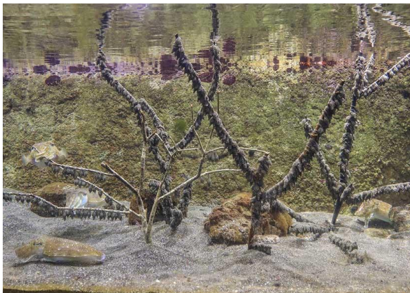
&lt;鈴なりにになった産卵用の枝&gt;