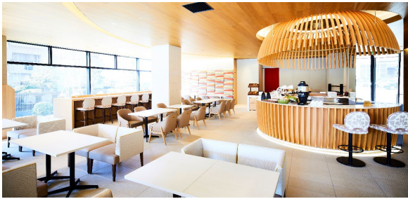
【インターゲートラウンジ】