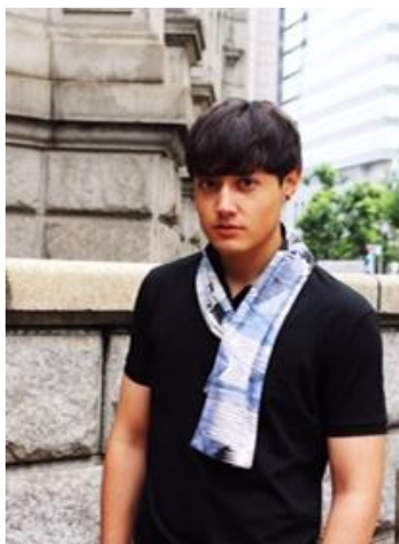
「ミニショール」15,000円(税別) by KAYAMA