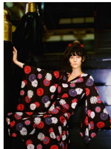
「着物袖ワンピース」68,000円(税別) by SOULWORK