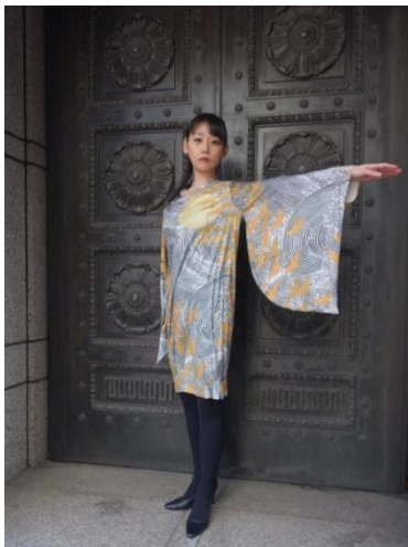
「着物袖OP」128,000円(税別) by KAYAMA