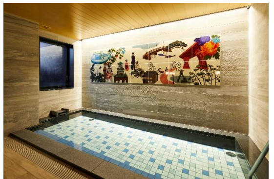
大浴場 / 金沢の名所がデザインされた壁画