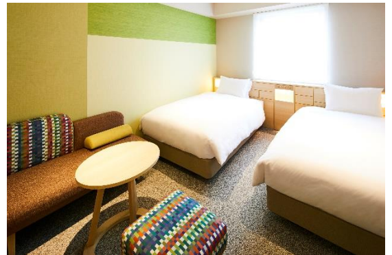
スーペリアツイン / 「加賀五彩」を用いたソファ