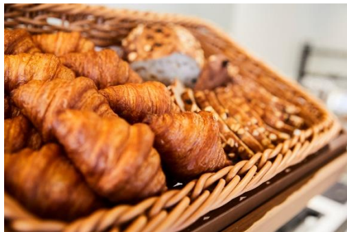
朝食メニュー一例