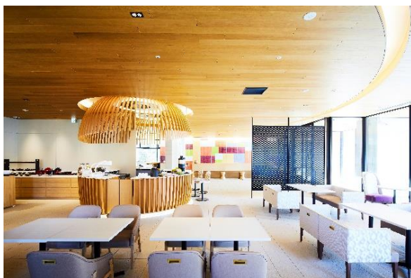
インターゲートラウンジ