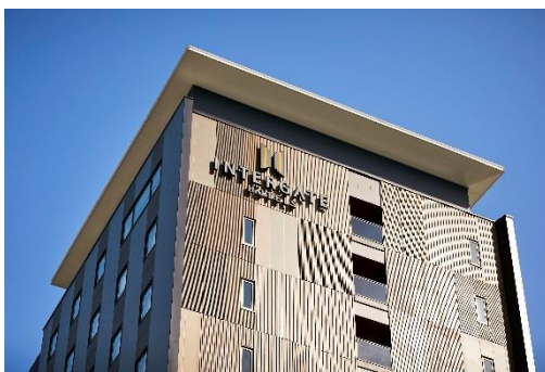
外観 / 金沢城の石垣のパターンをモチーフ