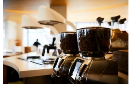
北陸地方初上陸「セラフィム」にて抽出

・A cup of coffee (ホットとするコーヒーの味わいが居心地の良さを演出) 地元コーヒー店と提携し、こだわりの一杯を提供するコーヒーカウンター ゲストとホテル、地域を繋ぐコミュニケーションの入口として、滞在中ご利用 いただけるコーヒーカウンターをご用意。70年以上にわたって地元で愛され てきた「ダートコーヒー(株)」のコーヒーをご提供いたします。世界の産地から 厳選されたコーヒー豆を使用したこだわりの味をお楽しみください。