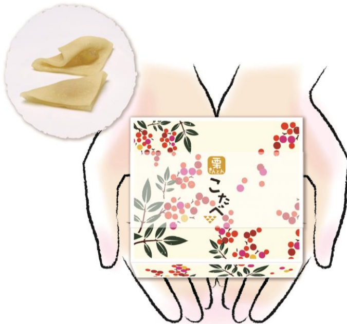
『こたべ』冬限定「栗きんとんあん」イメージ

さらにホテル公式ホームページからご宿泊予約いただくと、チェックアウト時間を1時間延長無料の特典も。ぜひ、この機会にご利用ください。詳細は次ページをご参照ください。