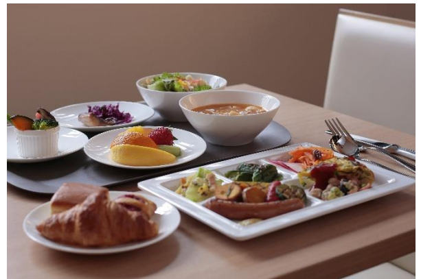
『焼きたてパンとごちそう野菜の朝ごはん』 朝食イメージ

ホテルインターゲート京都 四条新町では、京都の魅力を多くのお客様に、より知っていただきたいとの思いから、2018年3月の開業以来、京都市のご協力のもと伝統産業・文化のコト体験をインターゲートラウンジ(1F)にて開催しております。 伝統・文化体験 URL: https://www.intergatehotels.jp/kyoto_shijo/event/