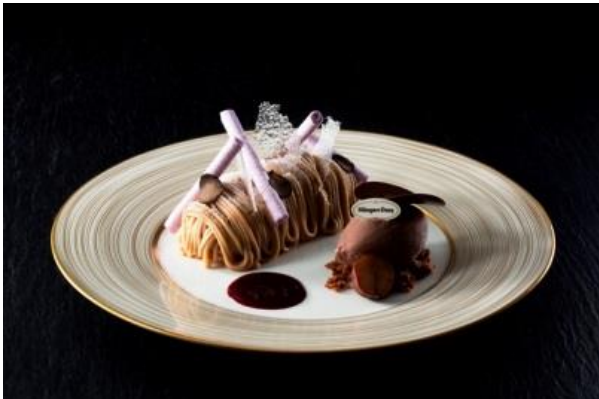
黒トリュフのモンブラン

■2018年9月1日(土)~9月30日(日) テーマ:「Early Autumn (秋のはじまり)」