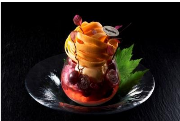
秋ぶどうの Autumn パフェ