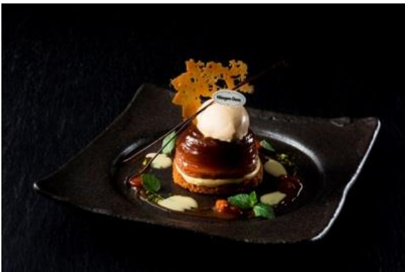
あかねりんごのタルトタタン