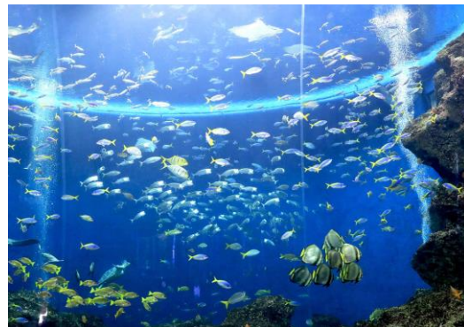
一夜を過ごす大水槽は幻想的な雰囲気