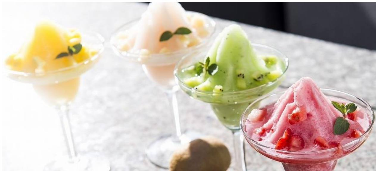
左より マンゴーフローズン / ピーチフローズン / キウイフローズン / ストロベリーフローズン(ノンアルコール)