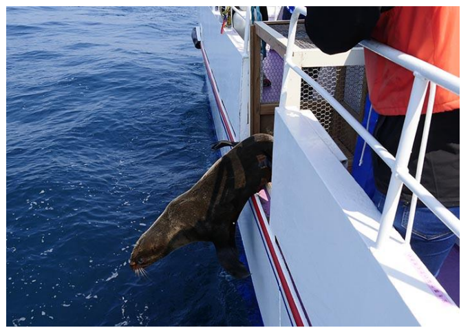
扉があき大海原へ