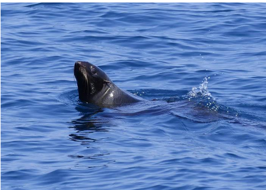
船の周辺を離れないキタオットセイ