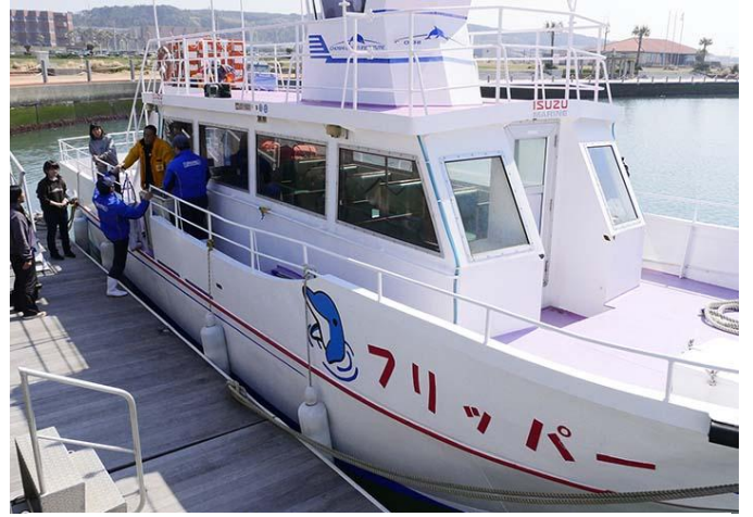
(有)銚子海洋研究所 フリッパー号