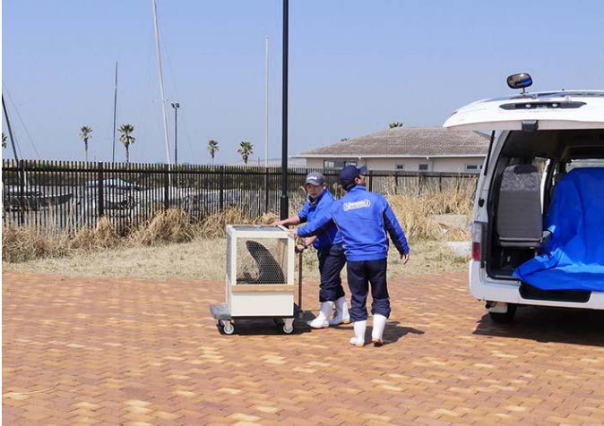
銚子マリーナに到着