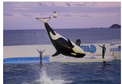
シャチスペシャルパフォーマンス(イメージ)