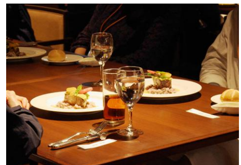
女性トレーナーとのディナー(イメージ)