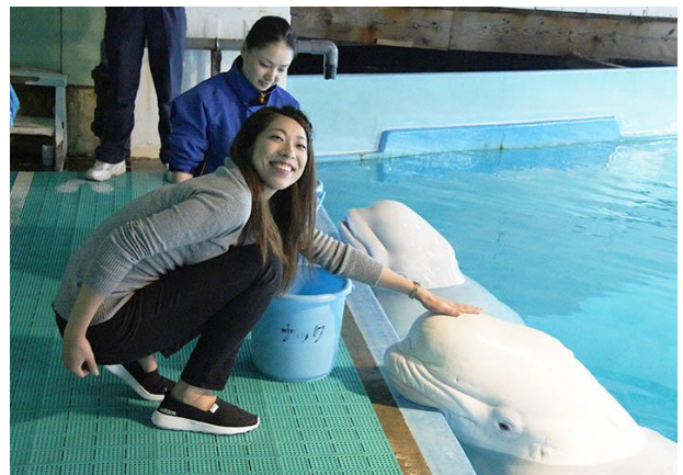
マリンシアター裏方でベルーガにタッチ(記念写真付き)