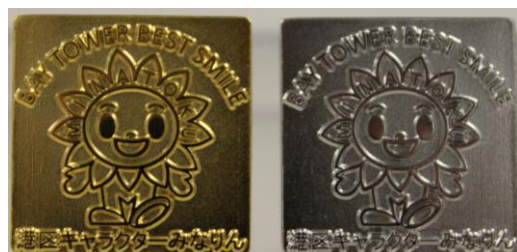
※ピンバッチ(港区公式キャラクターみなりん)

「ホテル大阪ベイタワーベストスマイル制度」は、一緒に働く仲間の笑顔や素敵な所を再発見し、その思いを広くお客様にも伝えたく、日々共に働く仲間を表彰する制度です。月間の最多表彰者にはホテル大阪ベイタワーが掲げるブランドバリュー「地域の価値の向上」のブランドメッセージに基づき、同ホテルがある港区の花「ひまわり」の公式キャラクターみなりんをデザインした銀のピンバッチ、年間最優秀者には金のピンバッチを授与致しております。そのピンバッチを胸にたくさんの笑顔の花を咲かすべく日々努めております。