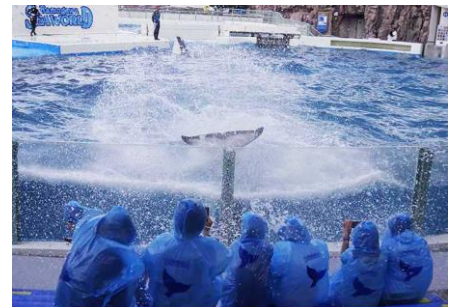
シャチのサマースプラッシュを体験

その他にも、ふだん見ることができない水族館の裏方見学や、夜の水族館探検、イルカタッチなどに加え、最終「シャチパフォーマンス」では、鴨川シーワールドオリジナルポンチョを身にまとい、豪快なシャチのサマースプラッシュを楽しみながらご観覧いただけます。