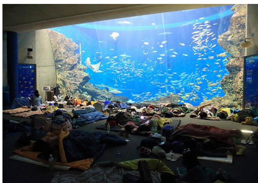
トロピカルアイランド・ナイトステイ

なお、ナイトステイ参加者は当日と翌日の2日間、鴨川シーワールドを自由にご観覧いただけます。