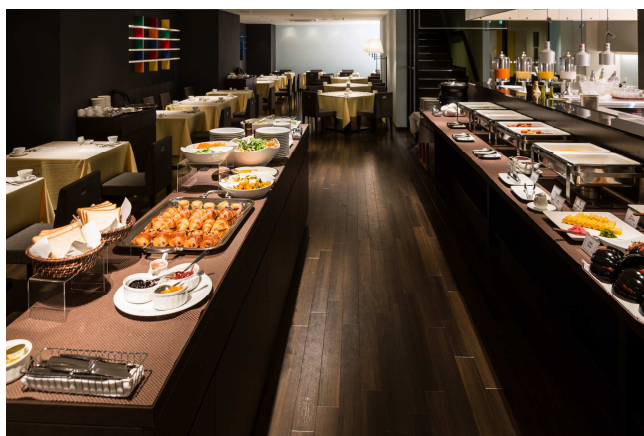
&lt;人気の銀座はちみつトーストやスムージーを置いた朝食&gt;