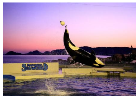
シャチ・スプリング・スペシャルパフォーマンス