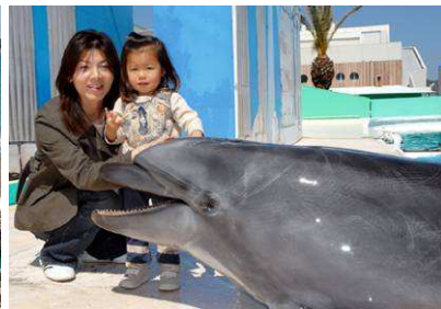
動物とのふれあい体験「イルカにタッチ」