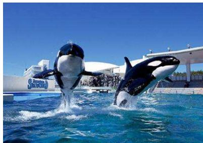
豪快なシャチパフォーマンス

800 種 11,000 点の海の動物を展示。海の王者シャチをはじめ、イルカ、アシカ、ベルーガ 4 つの動物パフォーマンスが人気！ご家族や友人、そして大切な人とともに、海の仲間たちとの楽しい癒しのひと時をお楽しみください。