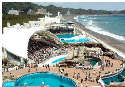
鴨川シーワールド 園内俯瞰