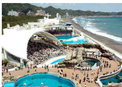
鴨川シーワールド 園内俯瞰