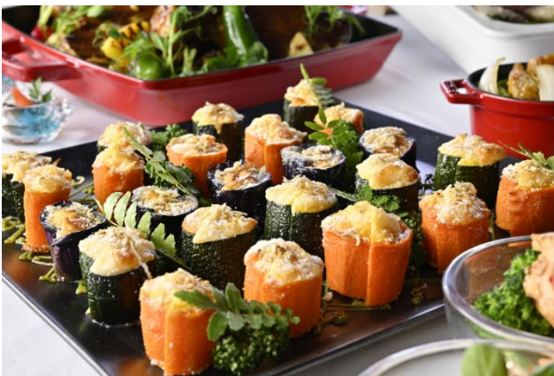
季節野菜の器で瀬戸内しらすのキッシュ