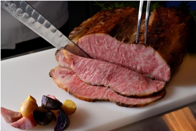
兵庫県産牛肉のローストビーフ(和風ソース)