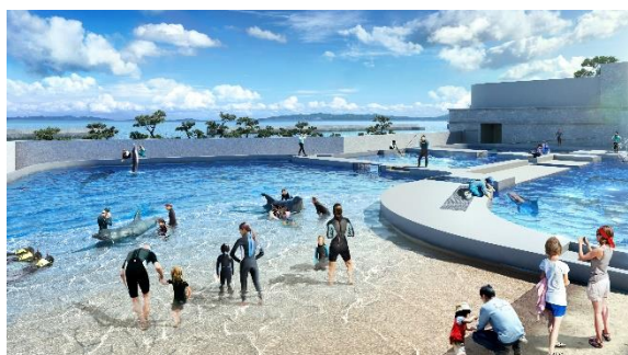
ドルフィンビーチ