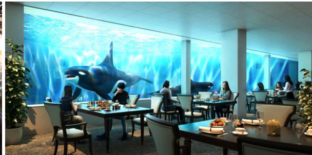
ブルーオーシャン オルカスタジアム