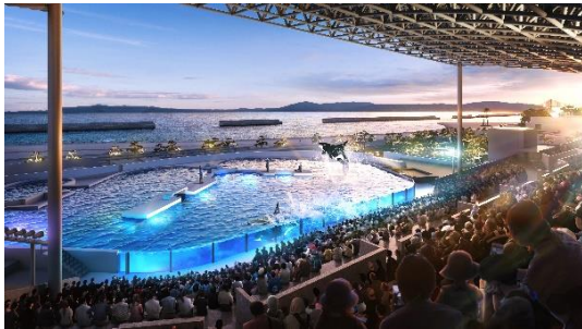
オルカスタジアム