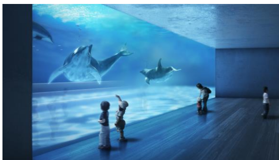
ドルフィンホール