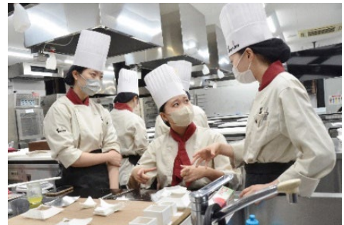
工芸菓子の制作に取り組む様子