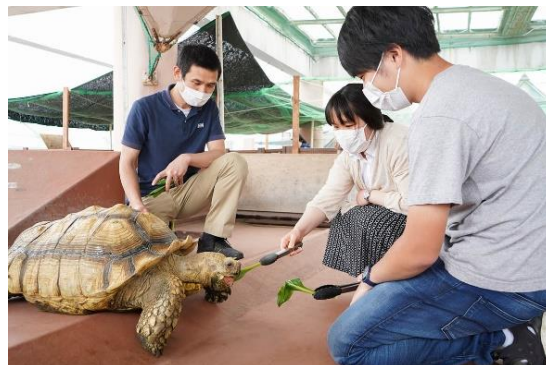
飼育員と一緒にエサやり体験（イメージ）

期間中は「ペンギンのエサやり体験」や「飼育員と一緒にエサやり体験」、オリジナルスタンプを集める「スマスイスタンプラリー」が復活。