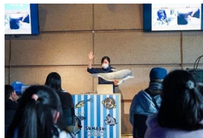
イルカ・ラボ・スクールの様子（イメージ）