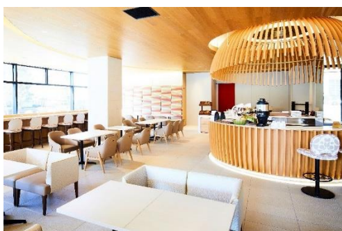
1 階インターゲートラウンジ

※ご宿泊のお客様は無料でご利用いただけます。（朝食・一部アルコールは有料です。）