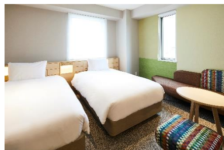
コーナーツインルーム（23㎡）

ご利用価格：コーナーツインルーム（23㎡） 平日2名様1室ご利用時 1名様 10,062円～ ※税・サ込・宿泊税別