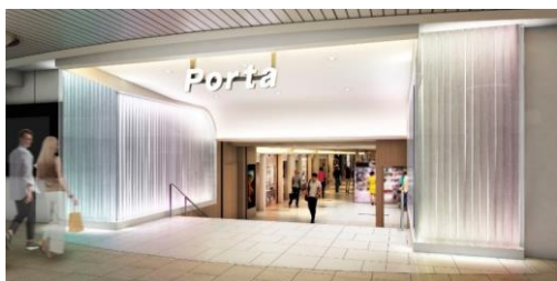
南エリア エントランスイメージ