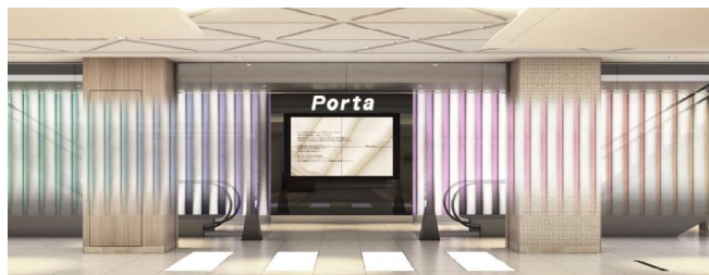
南エリア エスカレーター周りイメージ