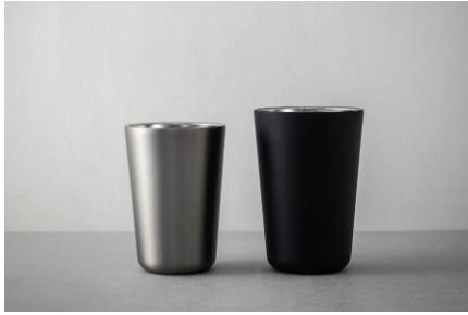
耐ハイタンブラー

酒好きから「こういうの欲しかった！」との声が続出し、待望の新アイテムが登場しました。シーズンを通して使える「おうち居酒屋」シリーズは、プレゼントとして喜ばれること間違いなしです。また、おうち時間で使用いただけるのはもちろんのこと、キャンプやアウトドアシーンでも冷たさをキープでき大活躍します。お客様に寄り添うピーコック魔法瓶は、自宅での晩酌時間をより良いものに変え、お客様の快適な生活を応援しています。