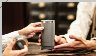
カフェのテイクアウトで お気に入りのカフェでもマイボトルでサステナブル