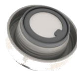
付け外しがしやすいパッキン