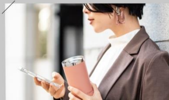
仕事の合間にも マグカップのような飲み口でほっと一息