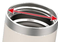
香り引き立つ幅広口径