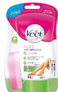
しっかり除毛 販売名: