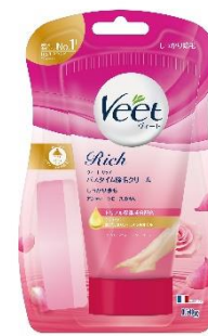
しっかり除毛 販売名: