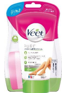
しっかり除毛 販売名: