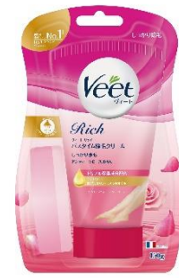
しっかり除毛 販売名: